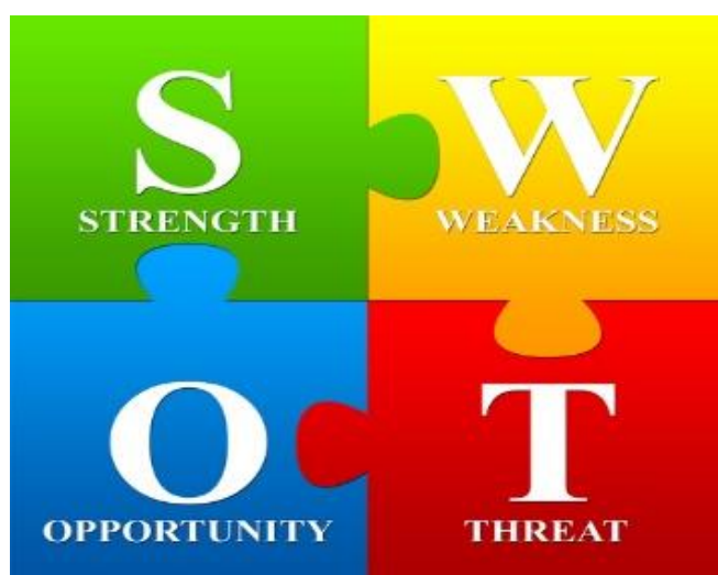
Diagrama de Análise SWOT: Pontos Fortes, Fraquezas, Oportunidades, Ameaças

Aqui estão algumas dicas sobre as oportunidades que podem ser adequadas para você e como você pode definir a sua estratégia para construir o seu negócio online de forma a ser capaz de demitir seu chefe.